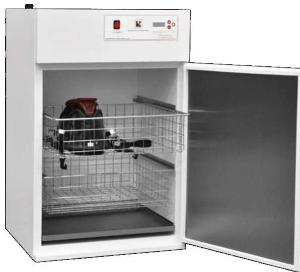
SUSZARKA M18, M45

Szafy do suszenia ubrań strażackich, butów, kapturów itp. Delikatny i skuteczny proces suszenia w temp. 36-40 °C. Szafa może być wyposażona w lampę UV lub w funkcję ozonowania.