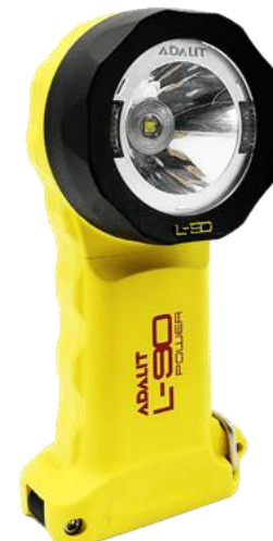
ADALIT L-90 Power/L-90R Power

Niewielka i łatwa w obsłudze latarka. Bardzo jasna – od 260 lumenów. Wysokie parametry techniczne i niska waga. Odporna na upadek z 4m. Odporna na korozję, chemikalia i wysoką temperaturę. IP67. Zasilana bateryjnie AA lub wbudowanym akumulatorem* (wersja R).