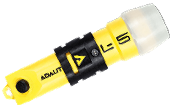
ADALIT L-5 / L-5R

Super lekka latarka osobista o doskonałych parametrach świetlnych 150lm. Waga około 130g! Odporna na korozję, chemikalia, wysoką temperaturę i upadek z 2m. IP67. Wyposażona w dodatkową czerwoną diodę LED →.