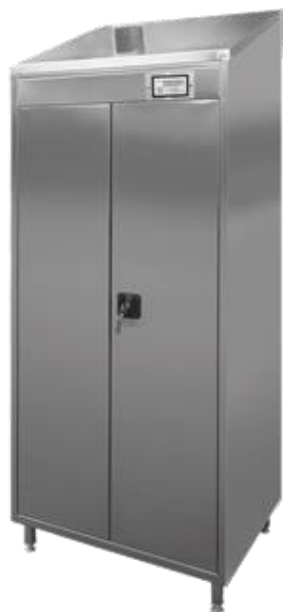
SZAFY ASF-4 i ASF-6

PROFILAKTYKA ANTYRAKOWA • MYCIE - SUSZENIE