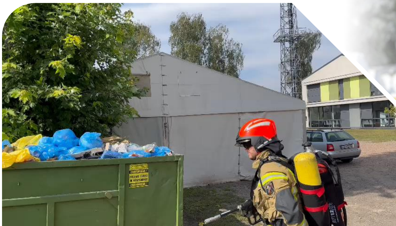
„Polowy sprawdzian możliwość MIST-12”

Sprawdź przed zakupem umów się na prezentację – skontaktuj się z nami!