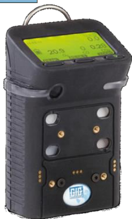
MICROTECTOR II G450

Microtector II G450, to kompaktowy detektor 4-ro gazowy wyposażony w duży wyświetlacz LCD umiejscowiony pod kątem w górnej części urządzenia. Stabilny i niezawodny w każdych warunkach.