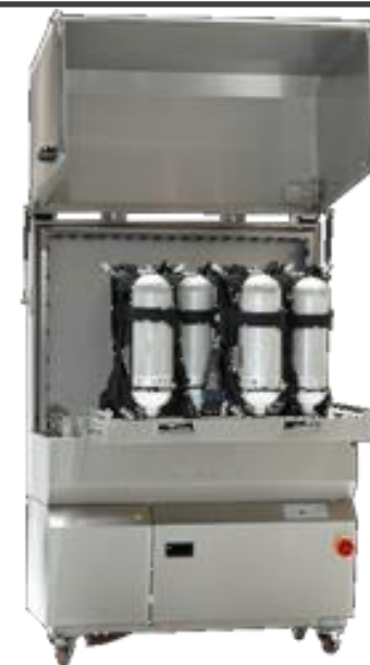
MYJKA WASH 4, WASH 9

Urządzenia do suszenia masek i aparatów powietrznych. Możliwość pracy w cyklu automatycznym lub ustawionym ręcznie.